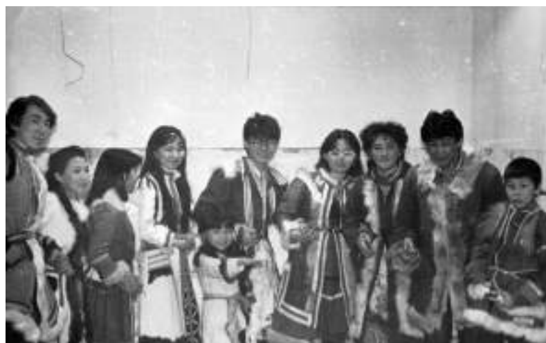
Фото предоставлено автором: Ансамбль "Секалан"